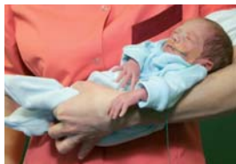
Sellili asendis: hoiu lapse selg kumer ja käed ees