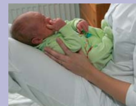
Istu poollamavas asendis, põlved kõverdatud. Hoiu last oma rinnal, selg kergelt painutatud ja istmik vastu kõhtu. Orsi lapsega silmsidet. Silta ja räägi temaga. See aitab luua teievahelist sidet