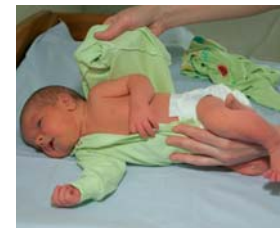
2. Riietamisel pööra laps küljele, juhtides teda reiest. Vasakule pöörates aita parema käega, hoides lapse paremast reiest. Pööramisel ära toeta last kehaviitest