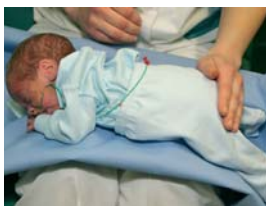
Kõhuli asendis: istudes hoiu last oma jalgadel. Jälgi, et lapse käed asetseksid keha lähedal