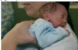
Krooksutamiseks tõsta laps oma õlale, toeta õlgadest ja puusast. Jälgi, et lapse käed on ees ja kael poleks pinges