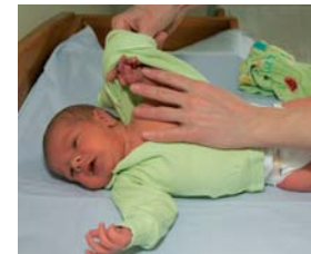
4. Pane oma käsi läbi lapse varruka, hoides kinni tema käest...