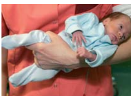
Küljasendis: asetage üks käsi lapse õla alla ja hoiu kinni tema reiest. Pea kontrolli arenedes kannu last vaheldumisi mõlemal puusal