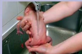
Aseta käsi lapse rindkere alla ja hoiu teda õlast. Lapse selg on kumer