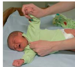
5. ....hoia lapse kätt hetkeks sirgena