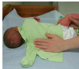
3. Korda eelnevat teisele poole