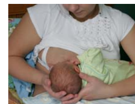
Rinnaga toitmine on lapsele parim. Hoiu last küljasendis. Jälgi, et lapse pea ja keha on ühel teljel