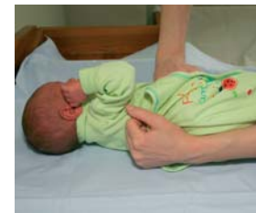
6. Lapsele on kegem pükse jalga panna küljasendis