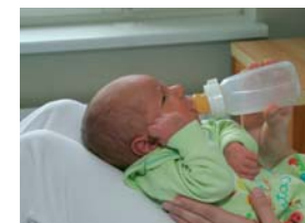
Üks lutipudelilist toitmise variant: hoiu last poollamavas asendis oma jalgadel

Posterit väljaandmist toetas Tallinna Lastehaigla Toetusfond ja kampaania "Suur samm edasi"