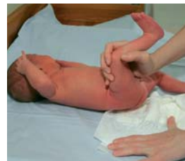
1. Mähkme vahetamisel hoiu kinni lapse reiest. Last reiest tõstes jälgi, et ta selg on kumer