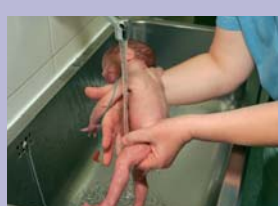
Korda eelnevat teisele poole