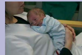
Istu poollamavas asendis, põlved kõverdatud. Hoiu last oma rinnal. Toeta teda seljast