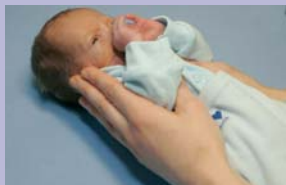
Aseta oma käed lapse õlgade alla