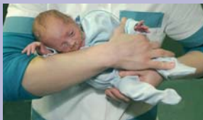
Aseta üks käsi lapse õla alla, toeta teda reiest