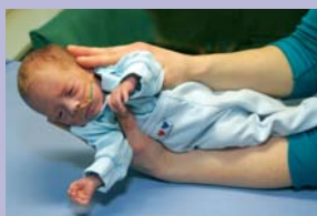
Pööra laps küljele, vajadusel toeta tema pead